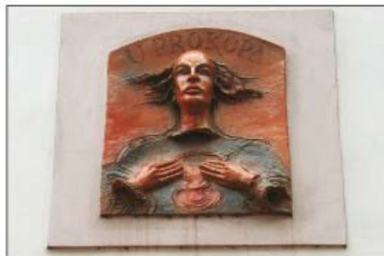
„U Prokopa“, Milíčov 6

(Pokr. příště) Z. Šesták, V. Micka, foto: B. Ludvík